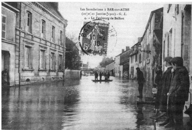
Bar-sur-Aube : Crue de 1910