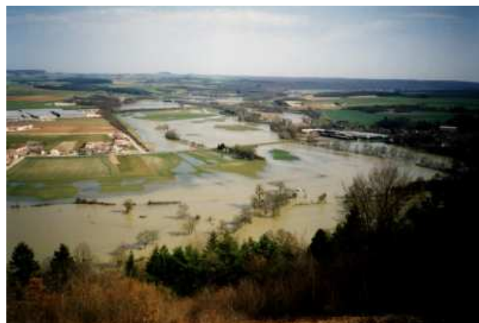
Bar-sur-Aube / Fontaine : Crue de 1999